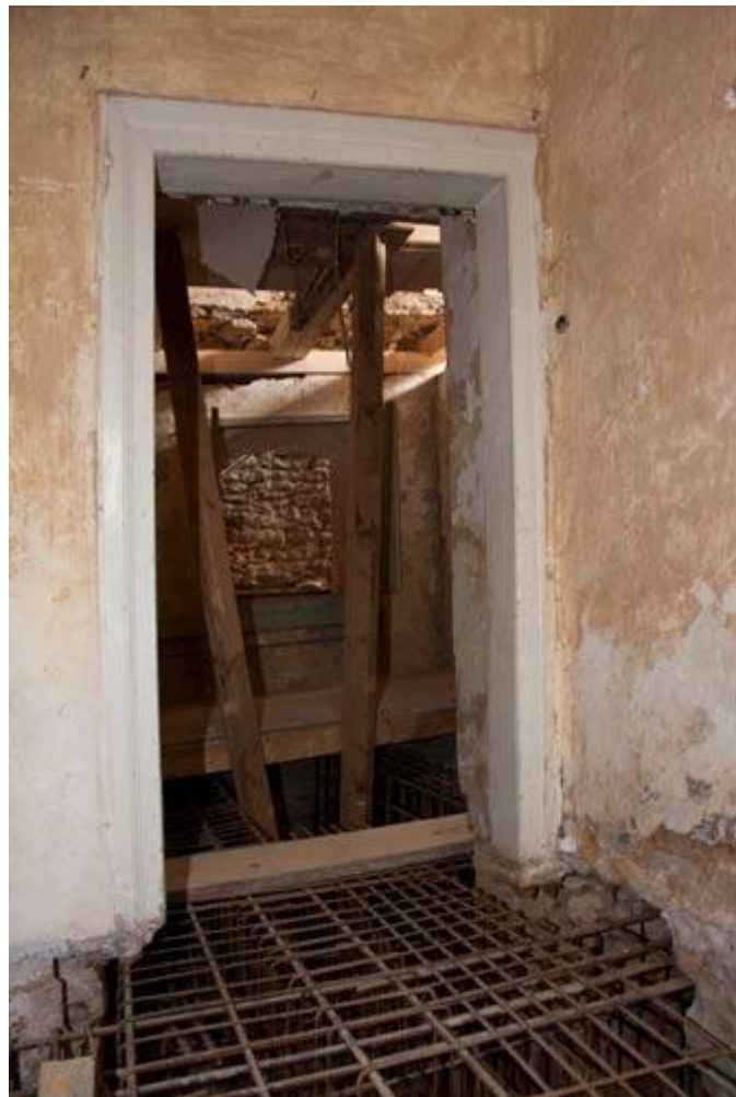
Blick auf das nach dem Guß der EG-Decke verborgen bleibende 'Innenleben' (2010)